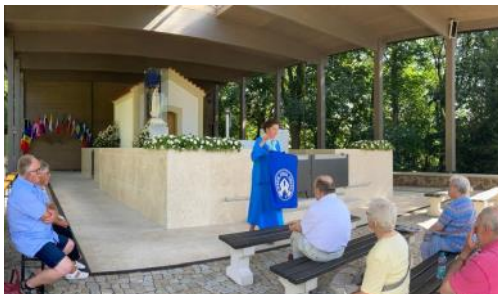
Neue Fatima-Kapelle in Ketzelsdorf

Liebe Ketzelsdorfer & interessierte Freunde, im vorigen Jahr konnten wir eindrucksvoll wie immer das traditionelle Heimattreffen in Ketzelsdorf an der böhmisch-mährischen Grenze erleben.